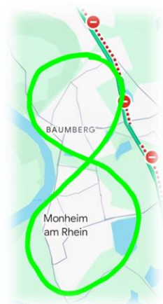
Karten: Google Maps, CDU Monheim am Rhein